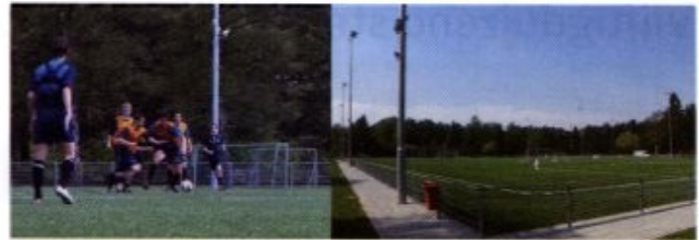
Figuur 2. Spelers dragen een hesje met twee meetpunten op de schouders en een transducer op de rug. Via een seriële interface is ook een hartslagmeter aangesloten.

Hetzelfde LPM-systeem van Abatec is, met een andere applicatie van TNO, ook gedemonstreerd voor de professionele schaatssport. Vanwege de locatie binnen een hal, en door interferentie van de ijsvloer, is de meetnauwkeurigheid hier zo'n 10 – 15 cm. Bij wedstrijd-schaatsen gaat het natuurlijk niet om